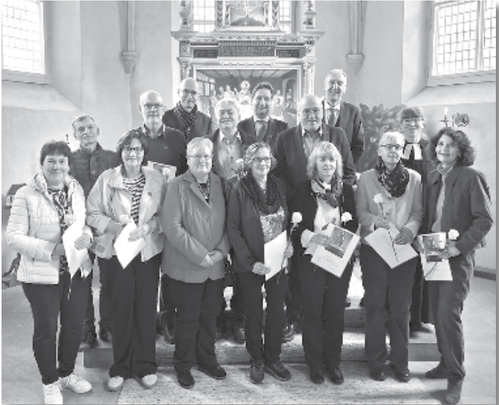
Text/Foto: Christof Schoon

Am 15. März feierten 14 Jubilar*innen ihre Goldene Konfirmation. Im Anschluss an den Gottesdienst gab es einen schönen Nachmittag mit Kaffeetrinken im Gemeindehaus.