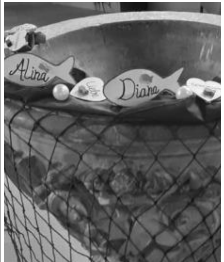
Geschmückter Taufstein in St. Nikolai