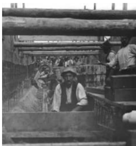
Polnische Arbeiter beim Bau des Mittellandkanals